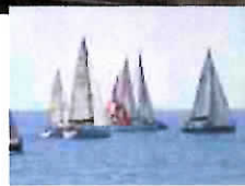
CASTIGLIONE SICILIA – La Città del Vino vince la IV Regata velica de I borghi a Cefalù (0)