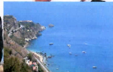
Taormina – In arrivo il mercato degli yacht a cinque stelle ... more