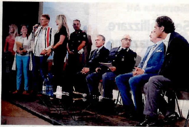
Evitare i rischi. Se ne è parlato in un incontro al Palazzo dei Congressi