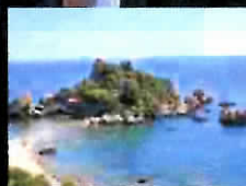
Taormina – Si prepara alla festa della vela (0)