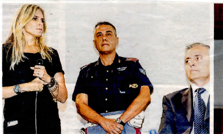
ri; ieri è stata anche la giornata della sensibilizzazione sulla sicurezza stradale;

Tutte pazze per Richard. L'attore statunitense, col suo fascino, eleganza e semplicità, ha scaldato non poco l'atmosfera della serata al Teatro Antico, invitando sul palco tutte le donne del pubblico per una foto. Una vera e propria invasione, un esercito al femminile colorato e agguerrito che lo ha letteralmente accerchiato. Gere si è confermato la grande star del Taormina FilmFest. A ruba, a Taormina, anche le copie di Gazzetta del Sud dove hanno trovato spazio tante immagini dell'attore statunitense nel suo soggiorno siciliano. Una vera e propria serata di stelle mercoledì al Teatro Antico, tantissime le presenze, come del resto è accaduto dall'inizio del Festival. Ad aprire la serata, presentata come di consueto da Tiziana Rocca, general manager del Festival, le note di "Alta Marea" cantata da Antonello Venditti poi spazio alla simpatia e alla comicità di Alessandro Siani. Fascino ed eleganza con Madalina Ghenea, la modella ha ricevuto un premio offerto da Shiseido e consegnatole da Alberto Noè, direttore della Shiseido Italia e dal direttore di Vogue Italia Luca Dini. E poi tanto glamour e mondanità fino a tarda notte alle esclusive cene del Festival. Colpita dalla bellezza della città