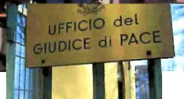
Taormina – Sette sindaci del comprensorio taorminese per rilanciare il Giudice di Pace di Taormina T... more