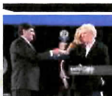
Taormina – La Perla alla corte di "ufficiale e gentiluomo" (0)