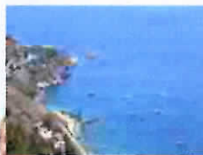
Taormina – In arrivo degli yacht a cinque stelle (0)