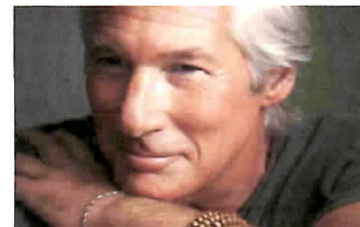
TAORMINA – CINEMA: RICHARD GERE AL TAORMINAFILMFEST